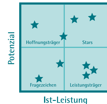
Überblick über alle Mitarbeiter